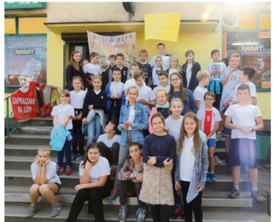
Uczniowie szkoły w Grojcu „czynnie” uczcili VI Światowe Dni Tabliczki Mnożenia.

30 września uczniowie szkoły w Grojcu już drugi raz brali udział w VI Światowym Dniu Tabliczki Mnożenia.