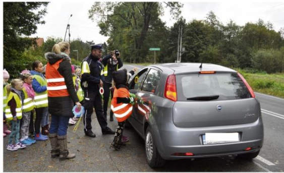
Poręba Wielka: za bezpieczną jazdę Wesoła Minka, za zbyt dużą prędkość – smutna.

W szkole w Grojcu także Dzień Chłopaka był Odblaskowy. "W poszukiwaniu odblaskowych dzentelmenów" dzieci w ramach zajęć na świetlicy przystroili się własnoręcznie przygotowanymi muszkami. Muszki i krawaty były nie tylko piękne, ale też, co najważniejsze, odblaskowe, więc nie tylko dały frajdę, ale też sprawiły, że uczniowie poczuli się jak panny i kawalerowie.