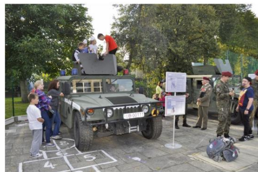
30 września, Piknik Patriotyczny w Babicach

i rehabilitacja będą kosztować ok. 500 tys. Zbiórki publiczne organizuje i koordynuje Fundacja Mała Orkiestra Wielkiej Pomocy. Jej nowym wolontariuszem jest Krzysiek Węgrzyn.