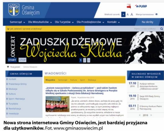
Nowa strona internetowa Gminy Oświęcim, jest bardziej przyjazna dla użytkowników.

Ważne elementy pozostałe ze starej wersji to kalendarze on-line, w których każdy może podejrzeć rozkład dnia Wójta oraz Zastępcy Wójta Gminy, a także rejestr umów zawieranych w gminie.